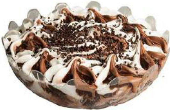
Italiensk islagkage i bowle, choko/vanille Item No 362370, 1 x 1300 gr. pr. karton

PS: skåle fungerer super godt til ToGo salater efterfølgende