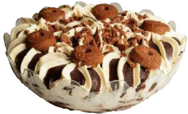
Italiensk islagkage i bowle, cookies Item No 362390, 1 x 1300 gr. pr. karton