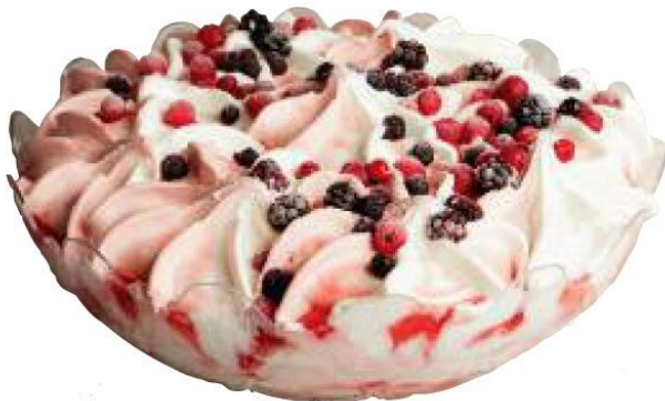
Italiensk islagkage i bowle, choko/vanille Item No 362370, 1 x 1300 gr. pr. karton